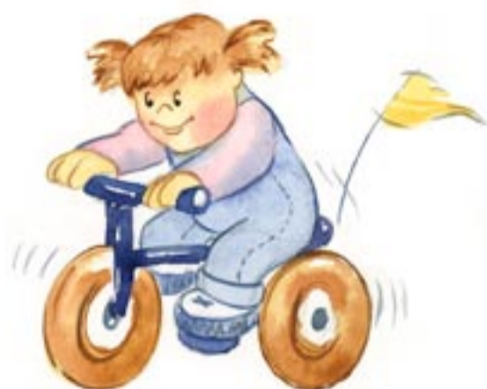
Aprendo a ir en triciclo.

El niño adquiere más autonomía, se autoafirma a partir del "NO". Es una etapa donde manifiesta toda la serie de adquisiciones iniciadas anteriormente.