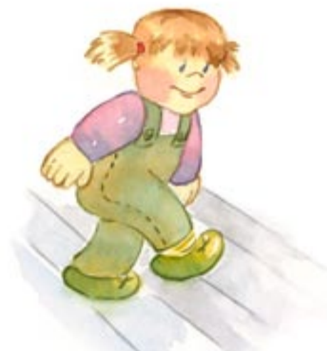
Se subir y bajar escaleras yo solo, alternando los pies.