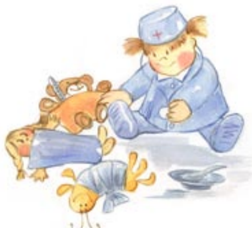
Juego a que doy de comer a mis muñecos y juguetes, hago luchas, pretendo ser médico, policía...

! SIGNOS DE ALERTA: Si a los 3 años no juega o siempre lo hace solo, no se relaciona con los otros, no muestra interés por el entorno o no mantiene la atención, CONSULTADLO CON EL PEDIATRA