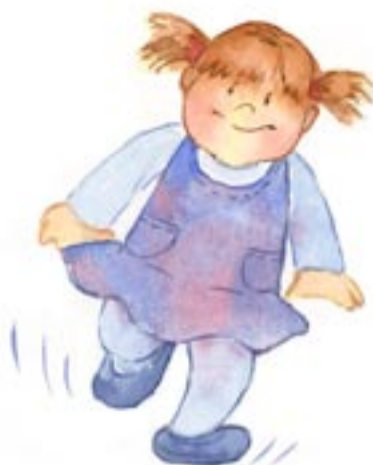
Intento andar a la pata coja.