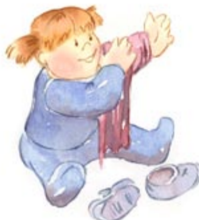
Empiezo a ponerme alguna prenda de vestir yo solo y a ponerme los zapatos.