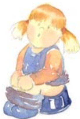
Controlo mis esfínteres y pido hacer pipí y caca.