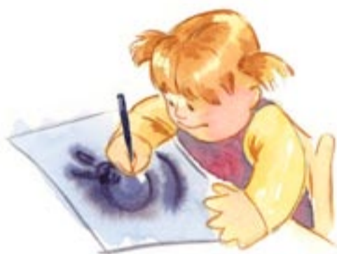
Con papel y colores comienzo a dibujar formas.