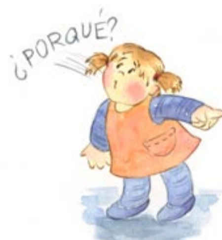
Ya soy capaz de decir "yo" señalándome a mí mismo. Me interesa mucho hacer preguntas como: ¿Y por qué?, ¿Y esto qué es?...