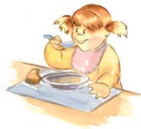
Ya como solo.