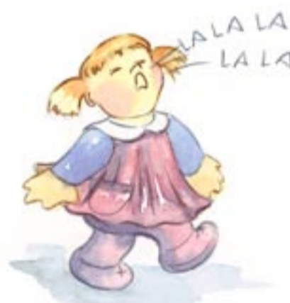
Digo frases de tres y cuatro palabras con sentido. Ya canto canciones.